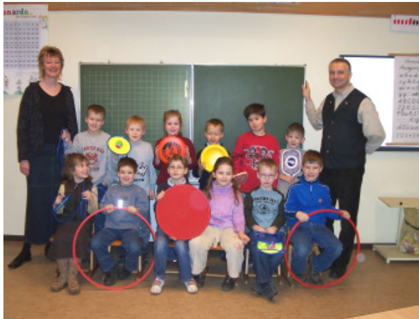
Die 1. und 2. Klasse