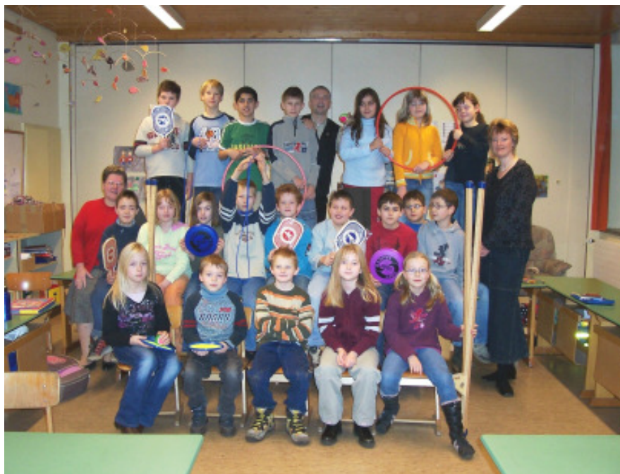
Die 3. und 4. Klasse

Impressum: Herausgeber, Verlag und Vertrieb: Gemeindefreier Bezirk Lohheide, Kirchweg 8, 29303 Lohheide, Tel. 05051/ 98670 Verantwortlich für den Gesamthalt: Bezirksvorsteher Wilhelm Adam